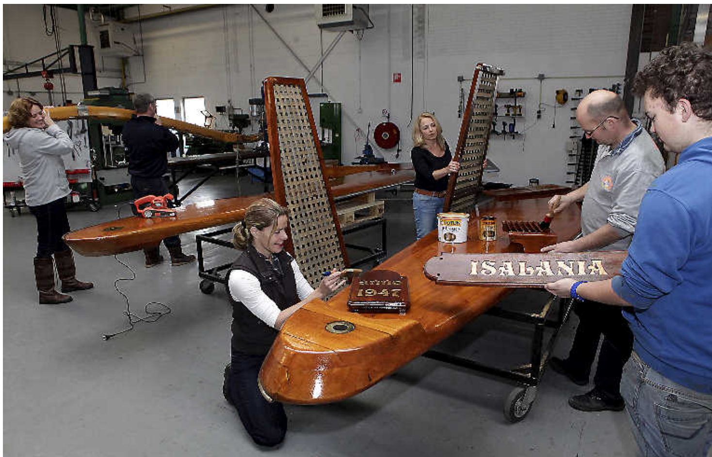
Restauratiewerk in volle gang.